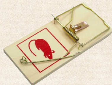
Trappole a scatto per topi in legno. 9,8x4,8 cm (2 pezzi) - cod. 99496 17,5x8 cm - cod. 99497