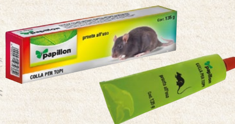
Colla per topi 135 g - cod. 97938