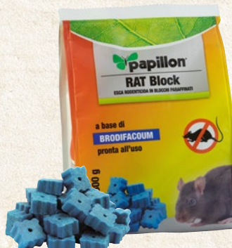
Esca rodenticida in blocchi paraffinati RAT BLOCK a base di brodifacoum con azione rapida. 300 g - cod. 51941