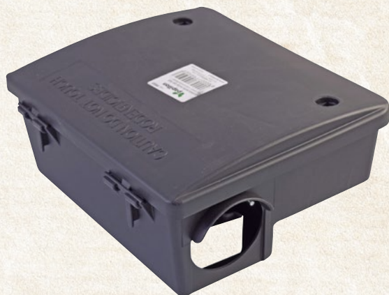
Scatola porta esche 22,5x21x10 cm - cod. 99502