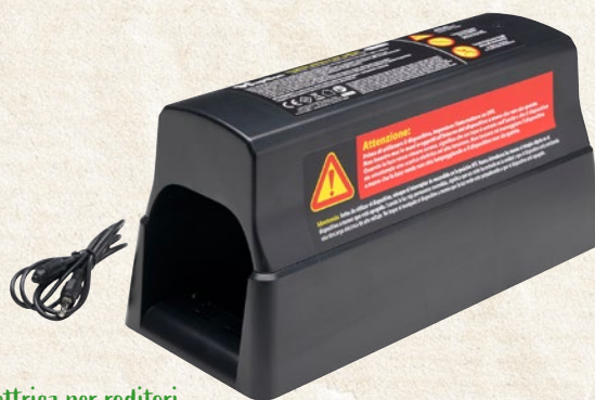
Trappola elettrica per roditori genera una scossa elettrica al passaggio del roditore, efficace, sicura e facile da pulire. Spia LED che segnala l'avvenuta cattura e alloggiamento per esca attrattiva. Funziona con 4 batterie di tipo D (non incluse), può essere alimentata anche tramite cavo di rete elettrica (non in dotazione) - cod. 900246

N.B. I dati e le caratteristiche tecniche dei prodotti riportati sul presente catalogo si intendono puramente indicativi. Ferritalia si riserva di apportare in qualsiasi momento variazioni alle caratteristiche tecniche e misure di tutti i modelli illustrati. Finito di stampare Marzo 2026