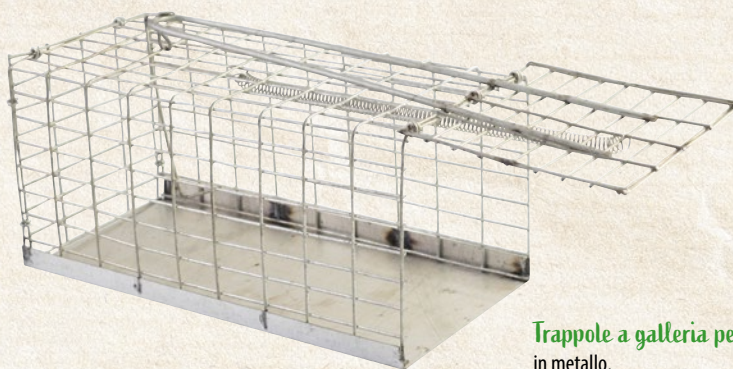
Trappole a galleria per topi in metallo. 21 cm - cod. 99537 30 cm - cod. 99538