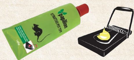
Attrattivo per topi esca alimentare per roditori in crema. Non contiene veleni. 100 g - cod. 50468