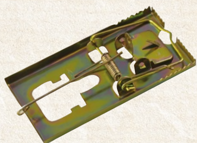
Trappole a scatto per topi in metallo. 9,5x5,2 cm (2 pezzi) - cod. 99500 16x8,8 cm - cod. 99501