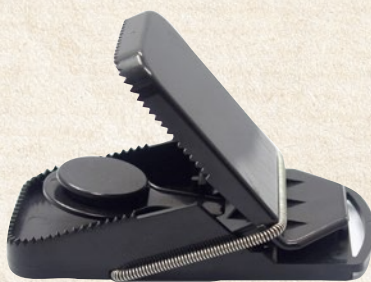
Trappole a scatto per topi in plastica. 9,5x4,7 cm (2 pezzi) - cod. 99498 19,5x10 cm - cod. 99499