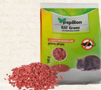
Esca rodenticida in grano RAT GRANO a base di bromadiolone. 140 g - cod. 51942