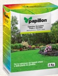
Per piante e giardino 2 kg - cod. 95703