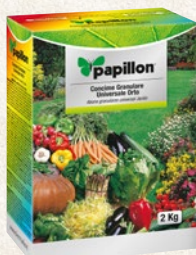
Universale orto 2 kg - cod. 95702

Linea di concimi per la nutrizione, la cura e la bellezza delle piante, del giardino e dell'orto. Presentano una formulazione in granuli da spargere sul terreno o da interrare.