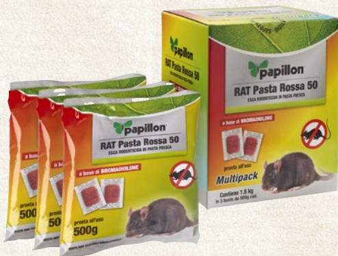
Esca rodenticida in pasta (multipack) RAT PASTA ROSSA 50 a base di bromadiolone. 1,5 kg (3 da 500 g) - cod. 83948